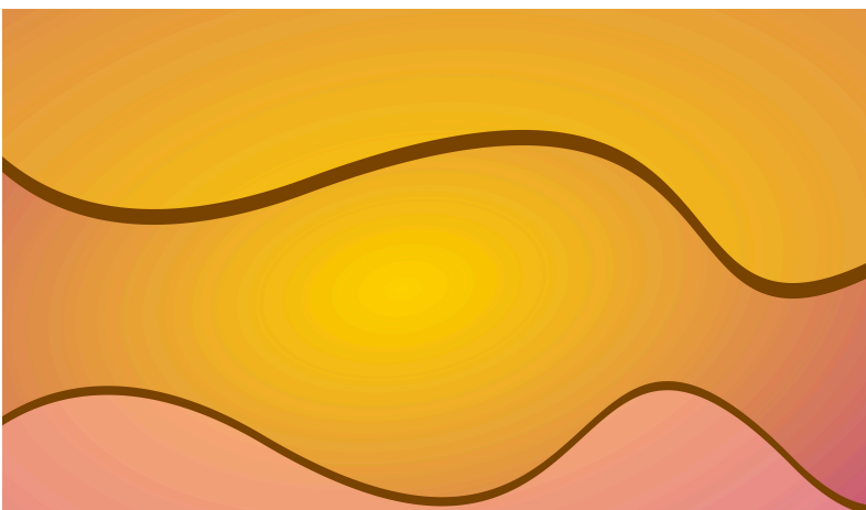
Figura 2 - "Movimenti sinuosi"

Oppure visualizzo l'intestino stesso che sinuosamente compie dei movimenti di contrazione e rilascio che favoriscono la peristalsi, come potrebbe rappresentare la seguente immagine (Figura. 2).