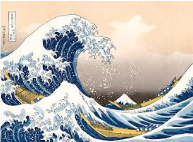
Figura 1 - "La grande onda di Kanagawa"

"La grande onda di Kanagawa" di Hokusai. Realizzata intorno al 1830, rappresenta un'enorme onda oceanica che si solleva minacciosamente al largo della costa di Kanagawa, vicino Tokyo. La potente onda si erge sopra diverse imbarcazioni da pesca, mentre i marinai lottano per mantenersi a galla, con il Monte Fuji visibile sullo sfondo. È un'icona dell'arte giapponese, nota per la sua composizione dinamica e l'uso del colore.